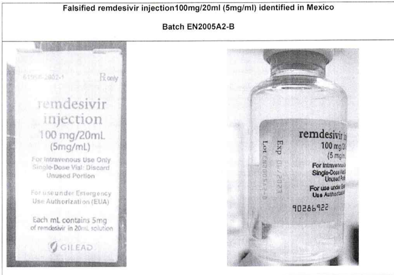
Table 2: Photographs of products subject of WHO Medical Product Alert N°4/2021

National regulatory / health authorities are advised to immediately notify WHO if these falsified products are discovered in their country. If you have any information concerning the manufacture, distribution, or supply of these products, please contact rapidalert@who.int